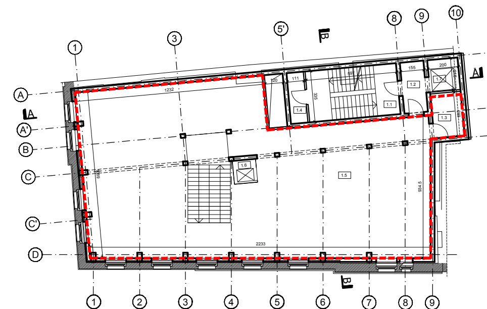
RZUT PIĘTRA 1 skala 1:250